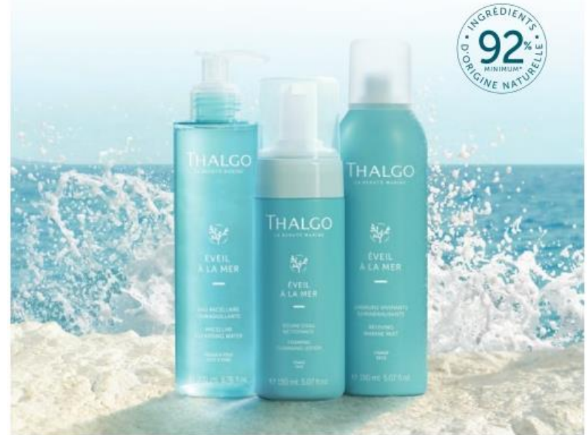
Desmaquilhante – Limpeza – Bruma Marinha