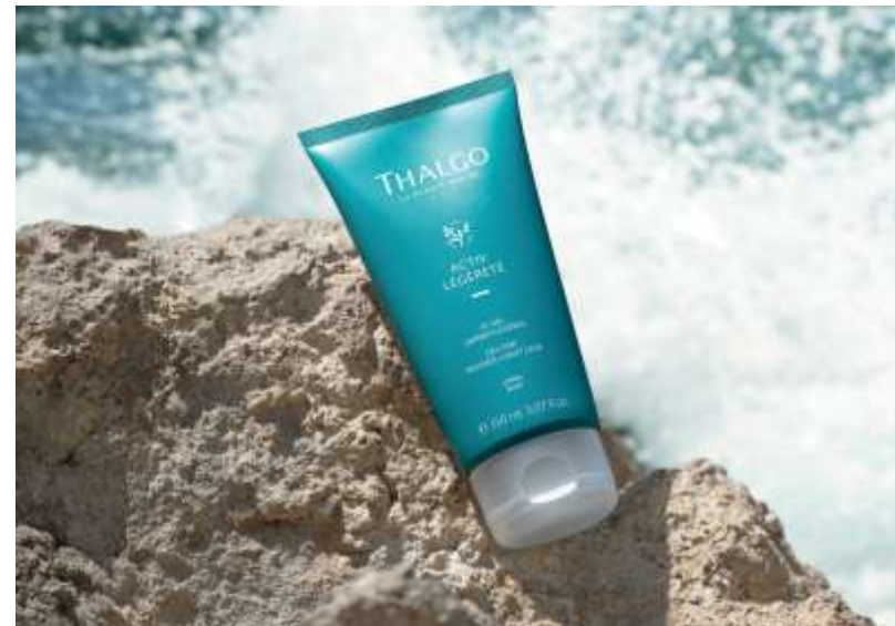
GEL JAMBES LÉGÈRES