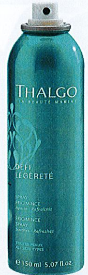
Spray Frigimince Thalgo 60,15€

Uma das piores consequências do verão são os escaldões e, apesar de estarem relacionados com exposição solar em excesso ou sem proteção, são responsáveis por aumentar a temperatura corporal. Sabemos que a prevenção é o melhor remédio, mas, quando o erro já está feito, pode aplicar compressas frias na pele para minimizar a extensão da queimadura. Além disso, utilize aloé vera de hora a hora (pode até colocá-lo no frigorífico para ficar mais fresco). No caso das queimaduras mais ligeiras, existem after suns em loção ou gel, formulados especificamente para baixar a temperatura do corpo ao mesmo tempo que reparam a pele e reduzem a inflamação devido aos ingredientes nutritivos.