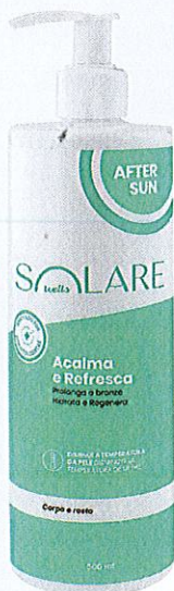
After sun Acalma e Refresca Solare 9,69€