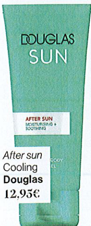
After sun Cooling Douglas 12,95€