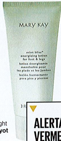
Loção energizante para pernas Mint Bliss Mary Kay 19€